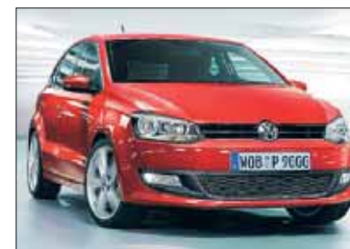
Komplett geliftet: der neue VW-Polo.

N ach dem VW-Golf ist jetzt auch der Polo komplett „geliftet“ worden. Im VW-Autohaus Bleicher in der Ravensburger Straße in Friedrichshafen kann das Modell gleich in mehrfachen Ausstattungsvarianten be-